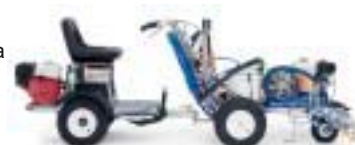
LineDriver propojený s LineLazerem III 200HS

Navštivte www.taps.cz k prohlídce zařízení pro vodorovné značení silnic