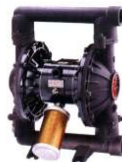
Husky 1590 Aluminium DxCxxx