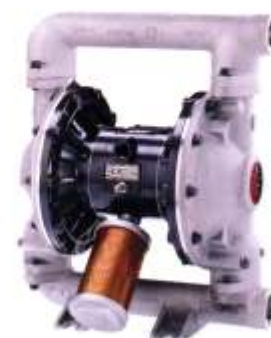
Husky 1590 SST - nerez DxDxxx